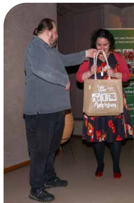
▲ Spreekster gaat niet met lege handen naar huis

“Fijn. Ik ga nog even de tentoonstelling bezoeken misschien kom ik nog een interessante spreker tegen.”