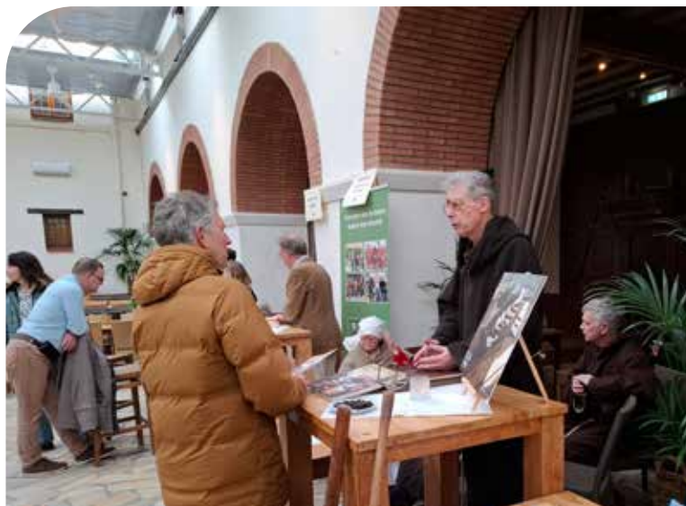
▲ Het was druk op 15 februari bij de banenmarkt

2025 belooft weer een mooi en actief jaar te worden voor de vereniging. Om te beginnen kijken we terug op de jaarlijkse banenmarkt waar we dit jaar weer nieuwe vrijwilligers konden verwelkomen, die hun steentje gaan bijdragen voor Archeon of VVvA zelf. Ook verwacht de vereniging weer verdere ledengroei.