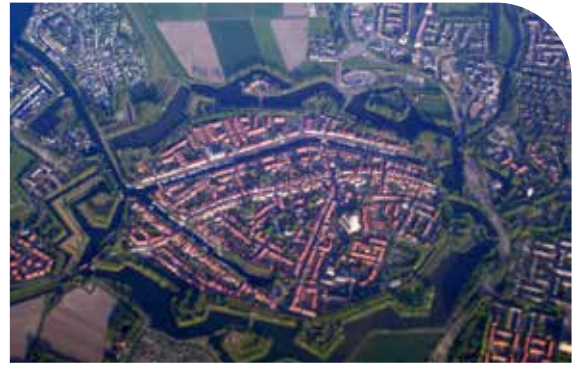
▲ Vesting Brielle

De activiteitencommissie heeft ook dit jaar weer een serie interessante lezingen gepland staan (zie agenda) en daarnaast ook excursies naar Hortus Populus en een vleermuizenexcursie. Verder staan de leuke steden Hellevoetsluis (ruim 600 jaar oud) en het 900 jaar oude Brielle met hun rijke geschiedenis op het programma.