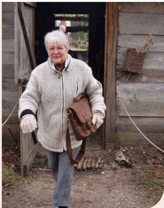
▲ Aan de slag

en woon alle bestuursvergaderingen van de VVvA bij. Ik lever namens en voor de vrijwilligers mijn aandeel in de bestuursvergaderingen en twee keer per jaar informeer ik de leden en vrijwilligers op de Algemene Ledenvergaderingen over de voortgang van het vrijwilligerswerk op Archeon.”