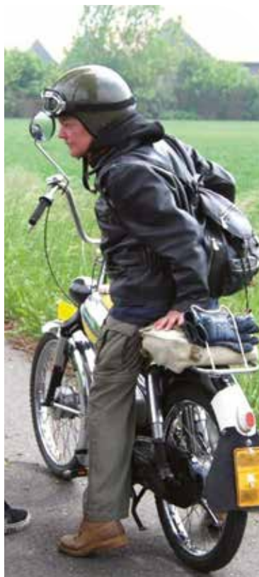
◀ Een belangrijke hobby

“Het is dankbaar werk, dat is zeker. Wel kan het soms belastend zijn. Ik woon in Hoofddorp en dan is telkens naar Alphen reizen best zwaar. Tegelijk vind ik het ook weer zo leuk dat ik thuis soms, op mijn eigen atelier, de vrijwilligers ondersteuning kan bieden bij het maken van hun kostuums voor het werk op Archeon. Maar vooral het contact met mensen vind ik fijn. Weet je, de meeste vrijwilligers zijn enorm lieve mensen. Ik geniet van hun contact en vind het heel gezellig om een biertje met ze te drinken na afloop van een pittige werkdag.”