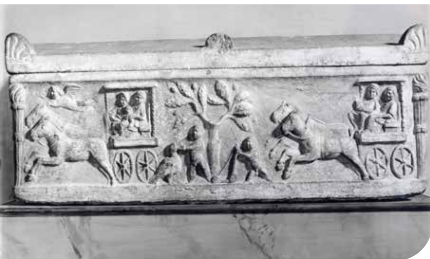
▲ Sarcofaag van M. Cornelius Staius. Louvre Museum, Parijs

Om mij extra te beschermen tegen onheil kreeg ik een 'bulla' om, een amulet gevuld met kruiden en magische steentjes, die ik pas mag afdoen als ik groot ben. Papa rammelde veel met een speeltje boven mijn hoofd, dat vond ik heel leuk. Van mijn broer kreeg ik een houten zwaardje, een bal en knikkers van klei om mee te spelen. Van mijn zus een serviesje en een pop, maar ermee spelen mocht ik nog niet. Ik moest eerst leren lopen, daar had ik een speciaal houten loopwagentje voor, kijk maar, daar staat hij! Mijn broer heeft ook een houten wagentje, maar dan groter, daar speelt hij echte wagenrennen mee na. Het leek hem zo leuk om dat later met mij samen te doen, maar helaas ging hij vlak voor mijn geboorte dood. Hij kreeg toen een mooie stenen grafkist, een sarcofaag. Daarop staat alles wat hij gedaan heeft in de vorm van plaatjes, dat leest makkelijker. Ook zijn naam staat erop, zie je dat?